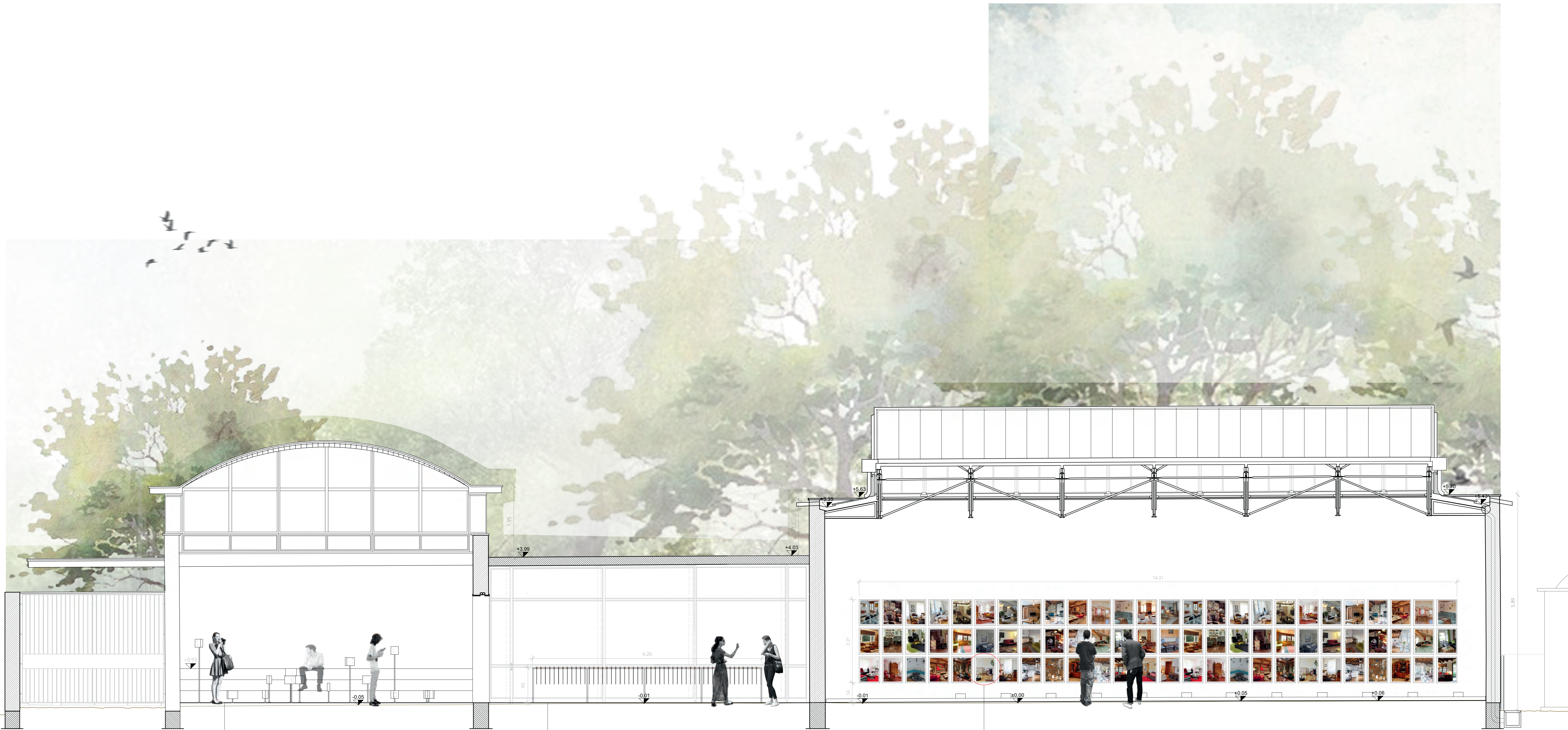
LÄNGSSCHNITT MST 1:50