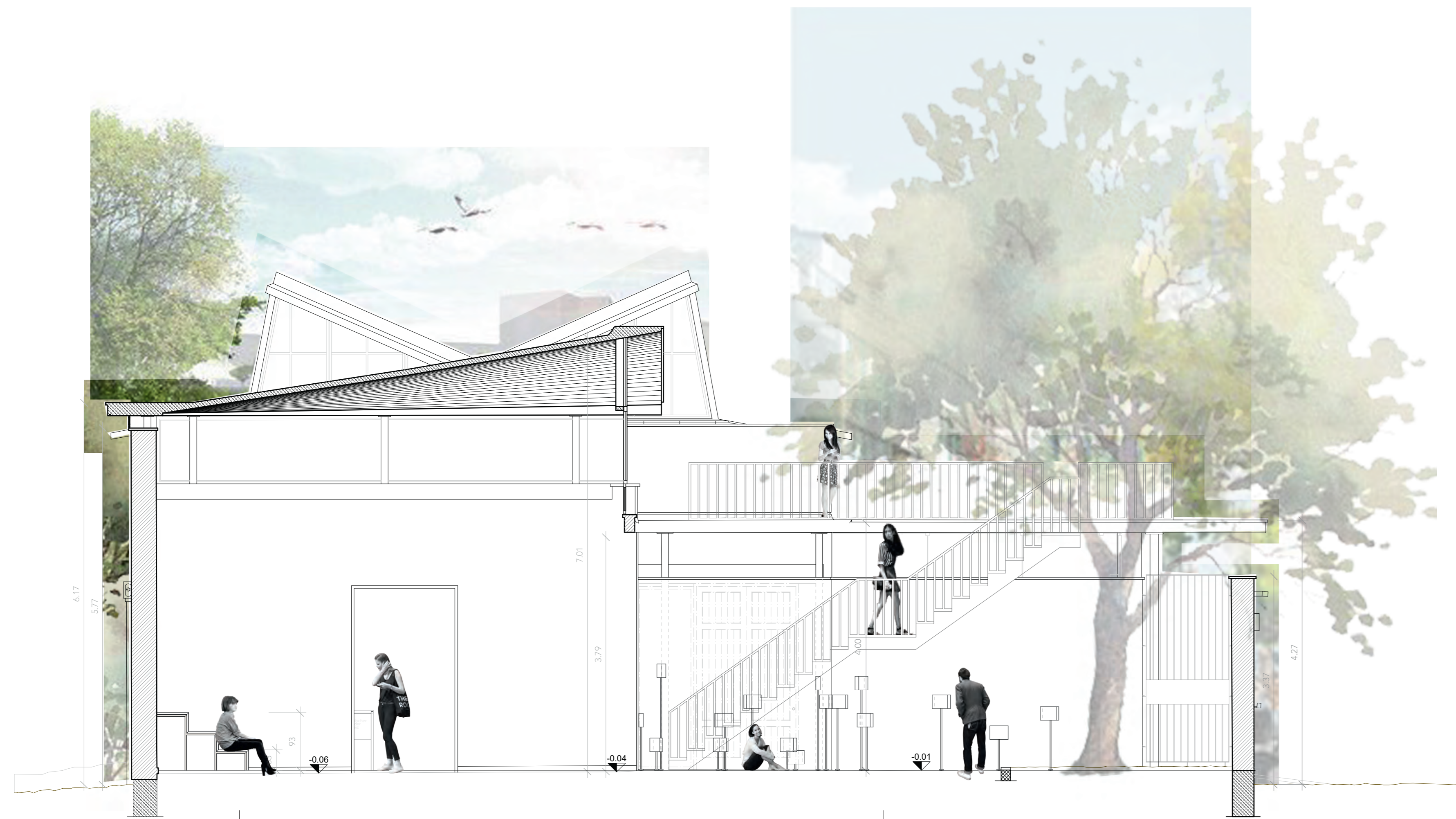
QUERSCHNITT MST 1:50